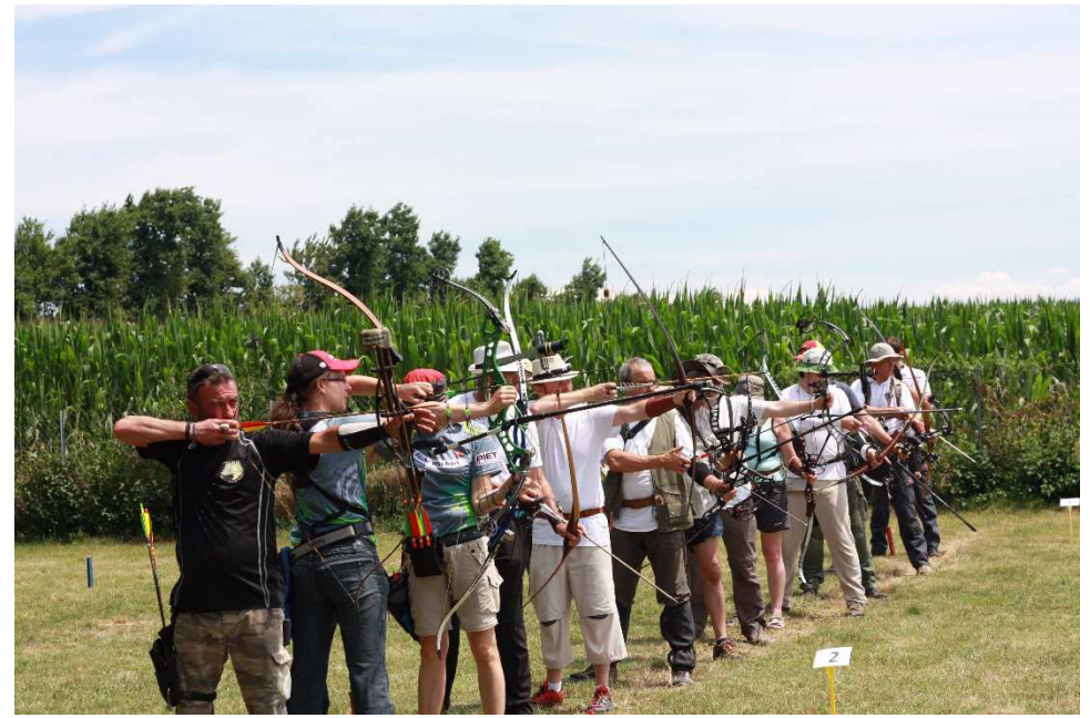
Commission parcours P.Rico