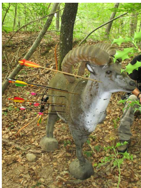
Commission parcours P.Rico