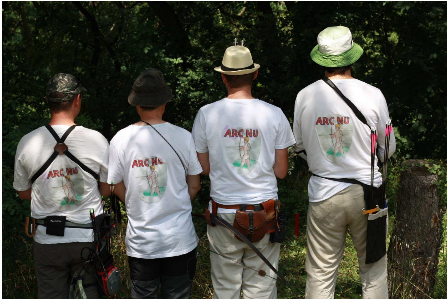
Commission parcours P.Rico