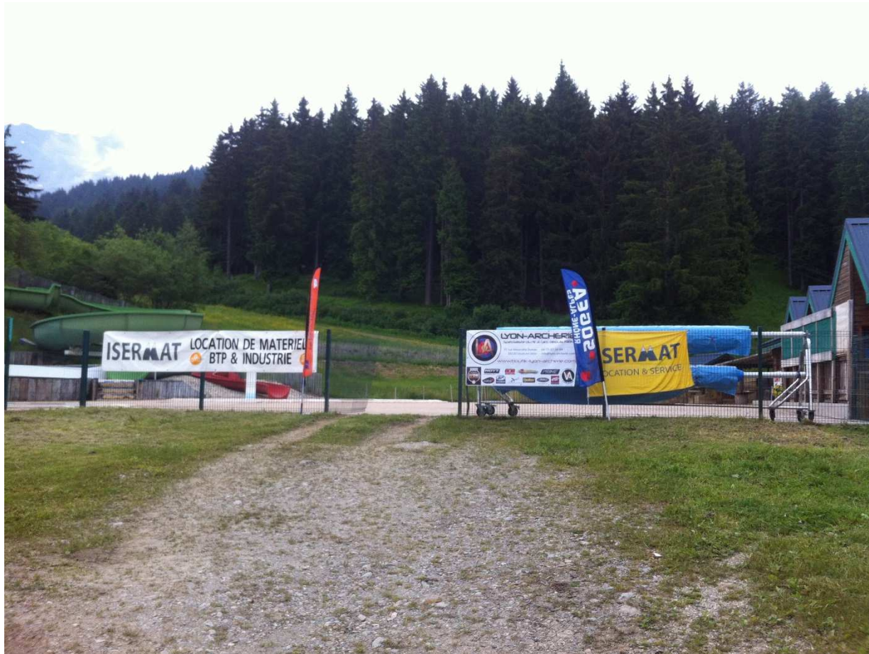
Commission parcours P.Rico