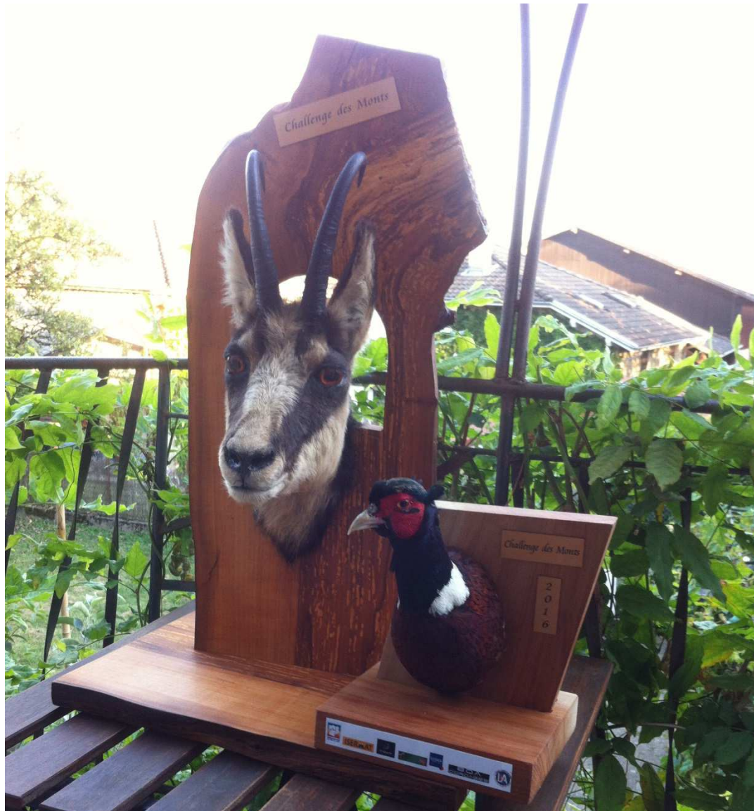
Commission parcours P.Rico