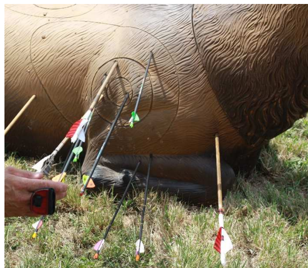
Commission parcours P.Rico